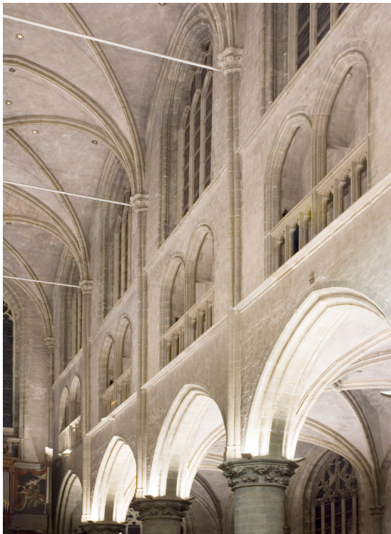
Het triforium of venstergalerij.

De kapitelen van de zuilen zijn gesierd met een dubbele rij koolbladeren, een typisch kenmerk van de Brabantse gothiek. Bij de bouw van het schip werden geen gewelven aangebracht, maar in plaats daarvan werd een vlakke houten zoldering gelegd. Tijdens de restauratie in de jaren dertig werd onder deze zoldering een stenen gewelf gemetseld.