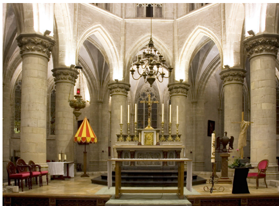
De koorkerk met het hoofdaltaar

De dwarsbeuk is veel lager dan schip en koor. De horizontale breuklijnen in het muurwerk tonen sporen van een verbouwing waarbij de dwarsbeuk werd verhoogd (5). In de oostmuur van de noorderdwarsbeuk (6) is niet gepleisterd muurwerk met een stuk waterlijst zichtbaar. Vermoedelijk heeft de oorspronkelijke dwarsbeuk uit omstreeks 1200, die later verlengd is, tot hier gelopen.