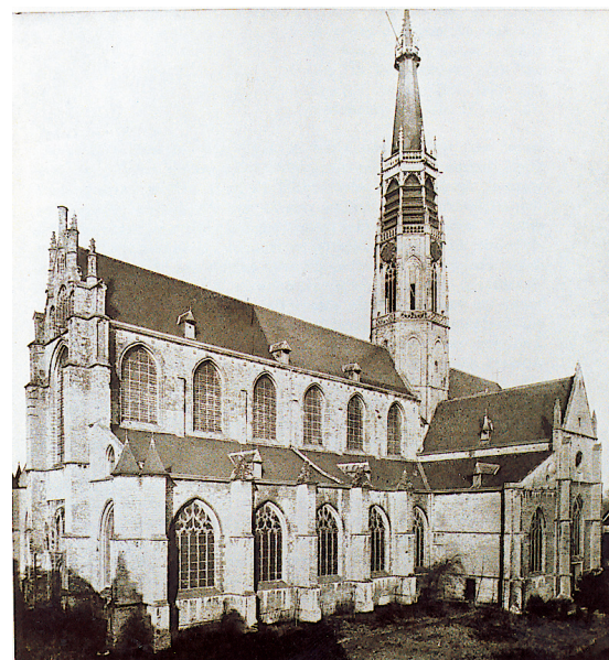
De kerk, vlak voor de restauratie van de jaren dertig, met de neogotische torenbekroning van architect Cuyper, nadat de toren door bliksem was getroffen en in brand was gevlogen in 1876.

Na afronding daarvan werd op 24 november 1935 de kerk door de paus tot Basiliek verheven. Tijdens de Tweede Wereldoorlog werd de neogotische torenspits die architect Cuyper na de brand van 1876 had gebouwd door de geallieerden kapotgeschoten omdat de Duitsers de toren als uitkijkpost gebruikten. Het duurde tot 1957 voordat de moderne betonnen torenbekroning kon worden gerealiseerd. Van 1996 tot 1999 is de kerk gerestaureerd. In tegenstelling tot de restauratie van de jaren dertig werd er nu voor duurzame bouwmaterialen gekozen.