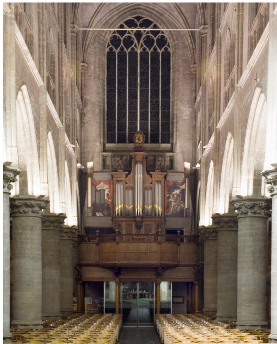
Interieur van het schipgedeelte

De trekankers (2) dienen om de zijdelingse druk die de gewelven op de muren uitoefenen op te vangen. Het middenschip lijkt hoger dan het in werkelijkheid is omdat de zijbeuken naar verhouding vrij breed zijn. In de onderste rij ramen wordt door middel van teksten in het gebrandschilderde glas de geschiedenis van het gebouw beschreven. In de westgevel is het glas-in-loodraam 'Het Laatste Oordeel' van glazenier Joep Nicolas te bewonderen (3). Het orgel is in 1610 gemaakt door orgelbouwer Louis Isoré.